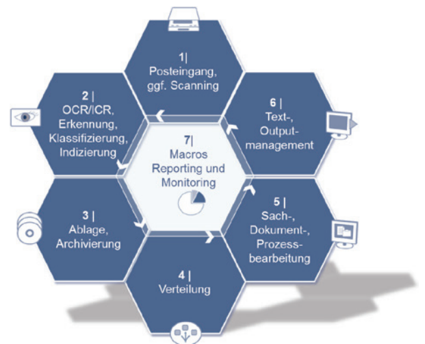
Abbildung 3: Macros eWorkplace – Standardsoftware als Basis für Macros eSolvency2